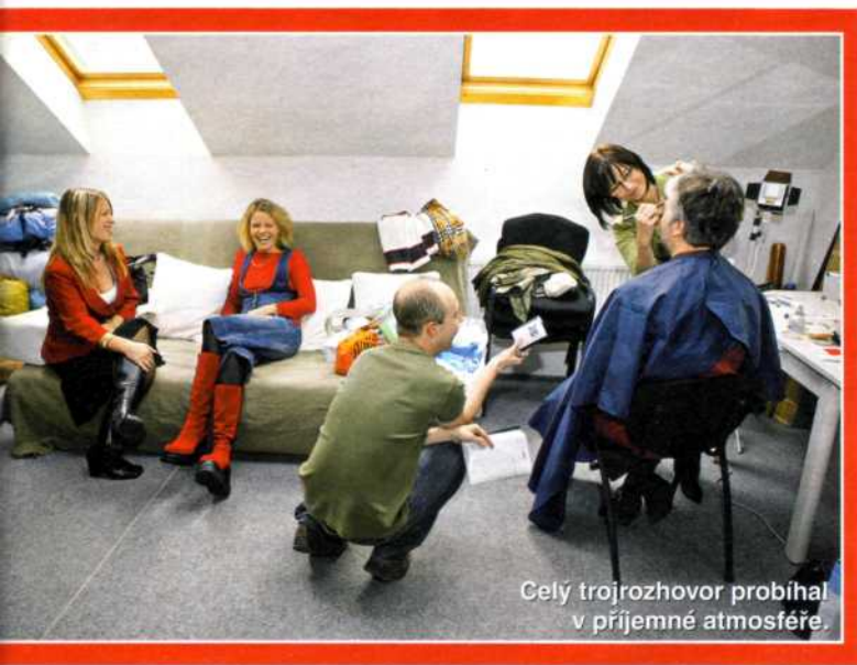
Celý trojrozhovor probíhal v příjemné atmosféře.