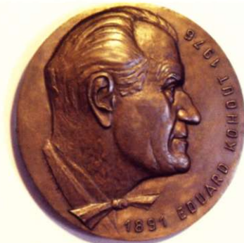
Reliéfni portrét Eduarda Kohouta ve Velkém divadle